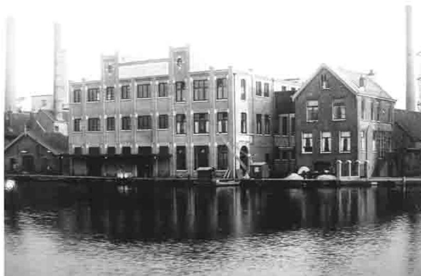
De gebouwen aan het Spaarne bij de Werf Hubertina, later aangekocht door Droste.