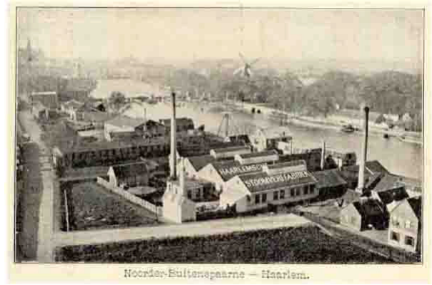
Locatie aan het Noorder-Buitenspaarne