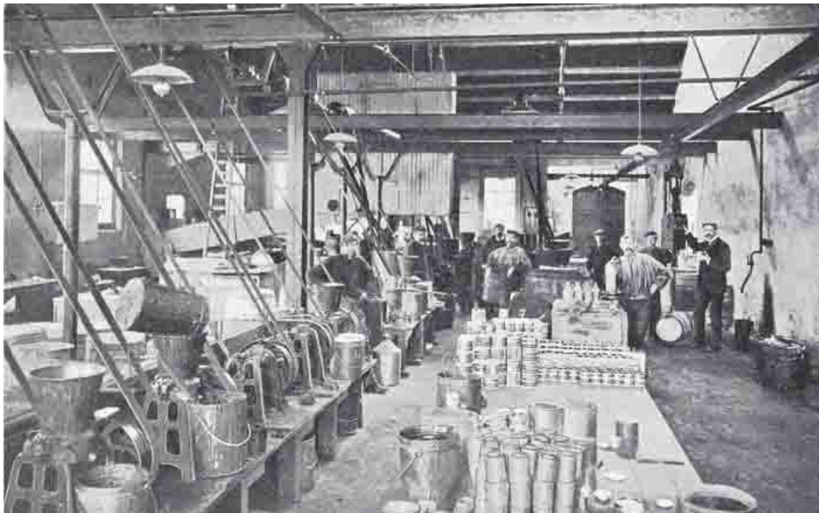
Foto van het interieur van de Haarlemsche Stoomverffabriek, voorheen W. Leur & Co.

Een aparte afdeling voor het fijnmalen en builen der vervaardigde verfstoffen benevens een andere voor het wrijven ervan in lijnolie en andere stoffen, werd de vereiste fijnheid verkregen, die voor direct gebruik vereist wordt, vormen met een eigen inrichting voor de vervaardiging van de benodigde emballage een geheel dat aan alle eisen voldoet. Als drijfkracht wordt gebezigd een gasmotor van ca. 35 E.P.K. waarvoor het gas (Dowsongas) op het terrein zelf wordt bereid, een dynamo, welke ter vermijding van krachtoverbrenging door conische kamradaren en lange drijfassen stroom levert aan drie op verschillende punten geplaatste electromotoren (elk een afzonderlijk deel van de fabriek drijvende) en een accumulatorenbatterij laadt die tot verlichting dient van de kantoren en werkplaatsen waarmee de machine niet werkt.