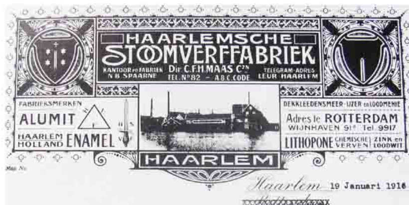
Briefhoofd uit 1916

Naast de aardverven (gele en bruine okers, ijzermeniën in verschillende kleurnuances en van hoog gegarandeerd ijzeroxidegehalte, waarvan in Nederland nog geen tweede fabriek bestond, werden de meeste chemische verven en producten vervaardigd.