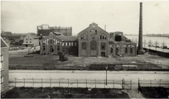
de voormalige Schotergasfabriek, waar later op het terrein de Stoomverffabriek gevestigd zou worden.