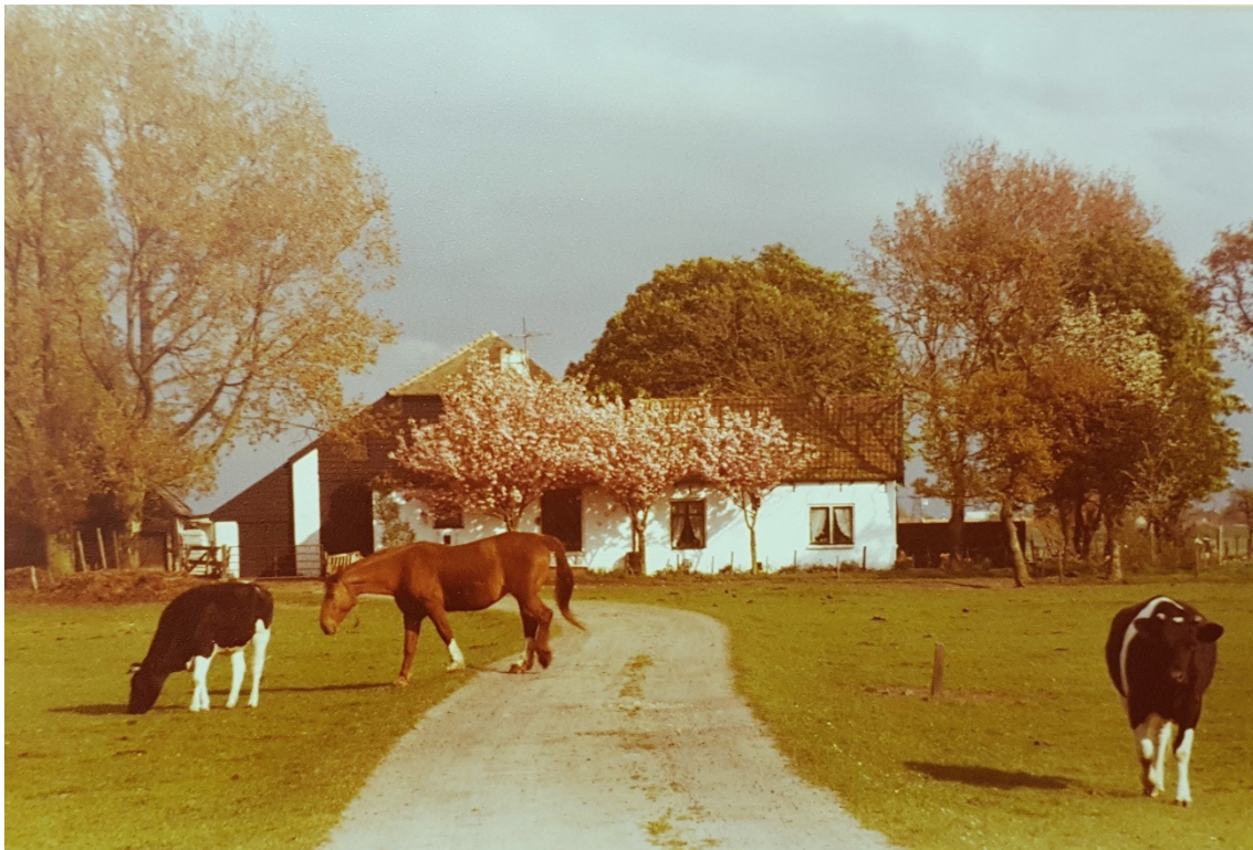
Boerderij Noord-Akendam in beter tijden.

Er is een streep gehaald door het plan voor restauratie van en nieuwbouw bij de monumentale boerderij Noord Akendam aan de Vergierdeweg. De grootschalige nieuwbouw en de stedelijke uitstraling ervan vormt volgens het college van B en W een ernstige aantasting van de cultuurhistorische en landschappelijke waarden van deze zeer bijzondere en landelijke plek. Het ernstig vervallen boerderijcomplex, is eigendom van Recreatieschap Spaarnwoude. Het bureau Huibrechtse & Koster Consultants heeft het plan Nieuw Akendam gemaakt voor de herbouw en het hergebruik van de boerderij. Die zou weer tot leven komen als fraaie buitenplaats met onder meer een restaurant met terras. Daarnaast zou er ruimte komen voor een medisch kleuter dagverblijf en dagbesteding voor mensen met een beperking.